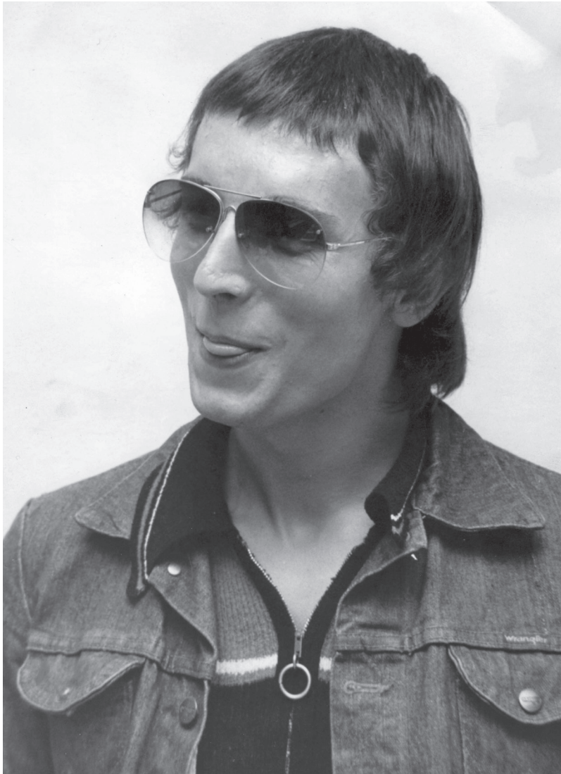
Na škole jsem se párkrát nevyhnul ostříhání, prej abych vypadal slušně. Tomuhle účesu jsem říkal „na blbečka“ a podle toho se tu taky tvářím.

sil zařídit. Tak jsem si přeseďnul na sedadlo spolujezdce a dal mu klíčky.