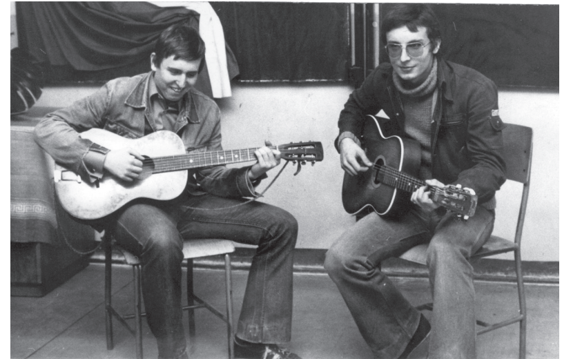
Jakmile jsme měli chvíli volna, brnkali jsme s kamarádama na kytary, to mě bavilo nejvíc. Doma, ve školních kapelách, kdekoli.

S touhle partou jsme si zahráli i ve slavným Děčku čili v klubu Dvojka na Vinohradech. Kluci z Destrukce potom začali hrát jazzrock, což bylo trošičku mimo moje gusto, a dokonce vystupovali na chmelech pro študáky, ale to už se jmenovali Segment. Takže Destrukce se přeměnila na Segment, akorát já už jsem s tím v tý době neměl nic společnýho.